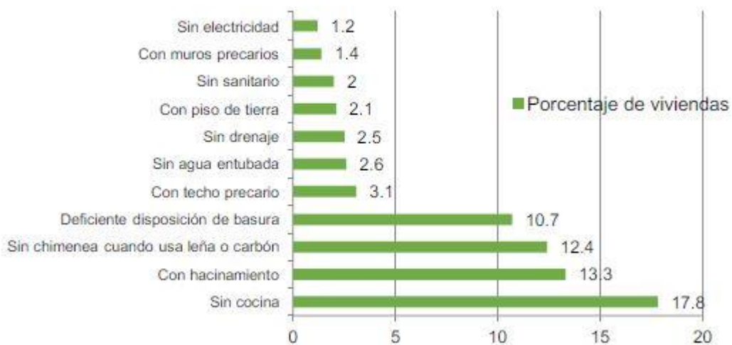
Gráfica 4.9 Principales rezagos en las viviendas de la entidad 2015

La entidad registró durante 2016 un millón 501 mil 562 personas y 441 mil 200 viviendas, en las cuales la carencia de cocina es el principal rezago en la vivienda, seguida del hacinamiento, la carencia de chimenea cuando se usa leña o carbón, techo precario, falta de agua entubada, drenaje, piso de tierra, carencia de sanitario, muros precarios y falta de acceso a la electricidad.